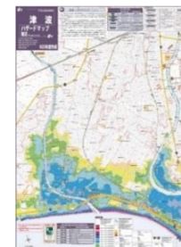
藤沢市津波ハザードマップ